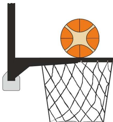
Obrázek 2 Míč v kontaktu s obroučkou

31 - 15 Ustanovení. Srážení míče nastává, když se během hodu na koš z pole obránce nebo útočník dotkne desky nebo koše, zatímco je míč v dotyku s obroučkou a má možnost padnout do koše.