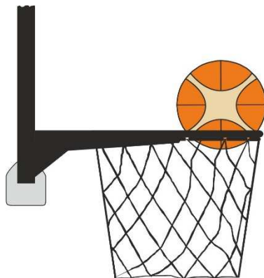
Obrázek 3 Míč v koši

31 - 21 Ustanovení. Jestliže se bránící hráč dotkne míče, který je v koši, je to přestupek.